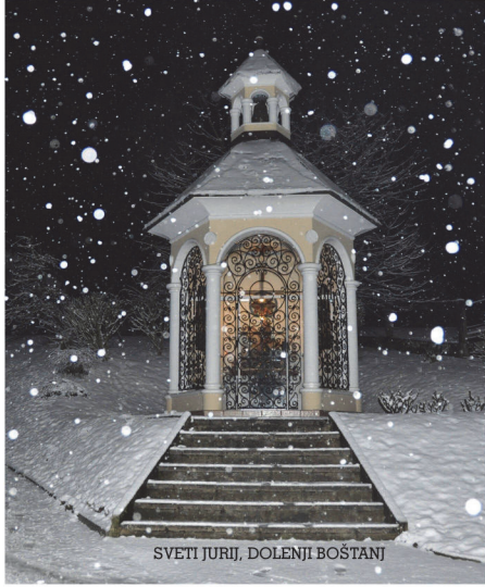
SVETI JURIJ, DOLEJNI BOŠTANJ