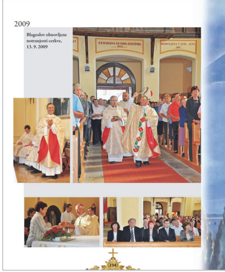
Blagodatno obnove notranjosti cerkve, 13. 9. 2009