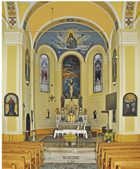
BOŠTANJ 2. list